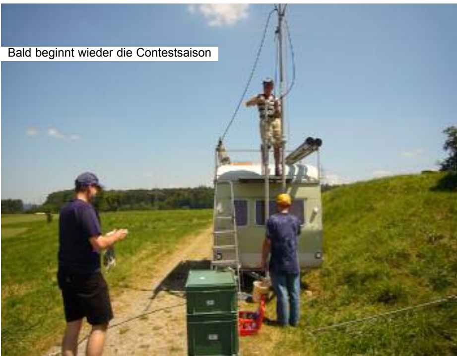
Bald beginnt wieder die Contestsaison

Ein weiteres Thema ist die Euro 08. Die USKA hat bekanntlich für uns das Rufzeichen HB2008W reservieren lassen. Da für das Diplom alle Rufzeichen in der "Luft" gehört werden sollten, ist das Ziel der USKA-Winterthur ca. 5000 QSOs. Im Moment sind